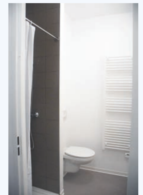
Un équipement de qualité pour ces studios d'un peu plus de 16 m 2